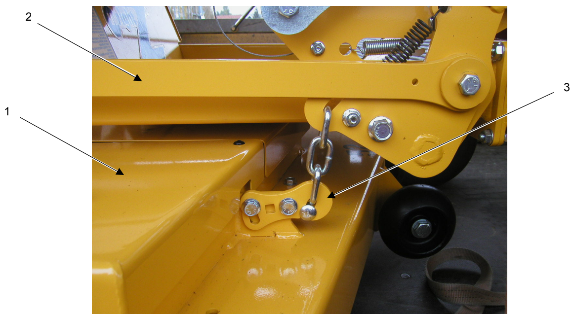
Figur 1 Justering av klipparkåpan lutning, framsidan av klipparkåpan

Om klipparen lämnar ränder kan det vara nödvändigt att justera de fyra kedjorna som kåpan hänger i. Kedjorna fäster klipparkåpan (1) till lyftenheten (2). Vardera av de fyra kedjorna har en justerplåt (3) på klipparkåpan ovansida. Lutningen mellan fram- och bakkant samt variationen sidledes på kåpan ska kontrolleras regelbundet, på en jämn och plan yta. Notera: det behöver vara en lutning på 6 mm mellan framkant och bakkant på kåpan, där framkanten ska slutta neråt mot marken. Justera en sida i taget vid justering av klipparkåpan höjd.