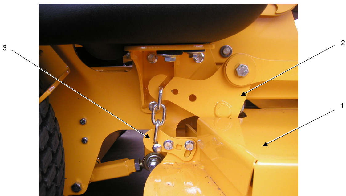
Figur 2 Justering av klipparkåpan lutning, baksidan av klipparkåpan